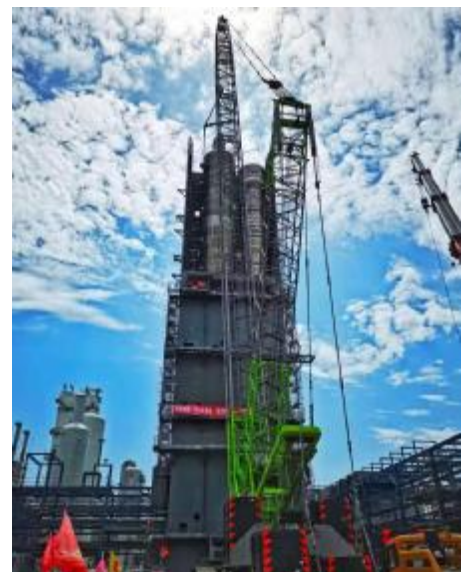
上图:镇海炼化扩建项目配套空分工程